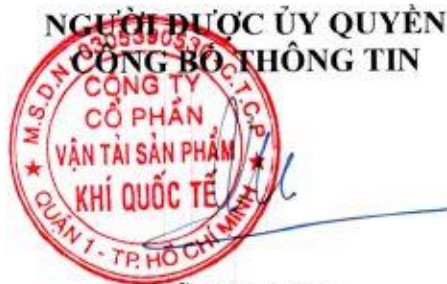
Đỗ Đức Hùng